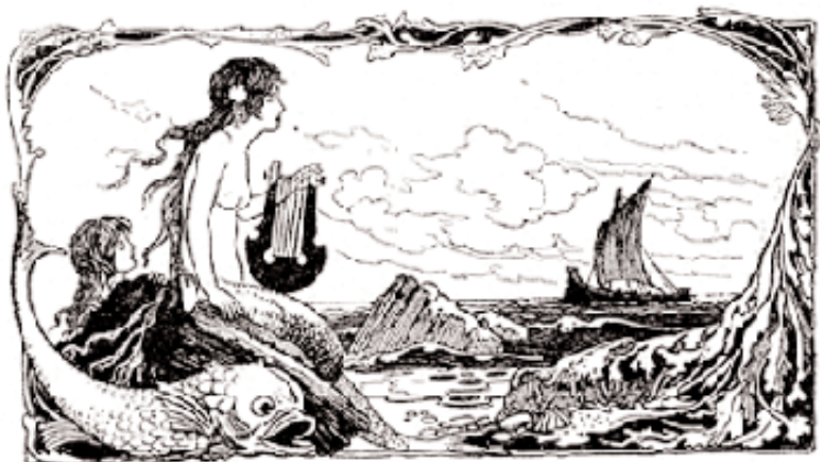
Ütal: Merineitsid , Warwick Goble'i illustratsioon „Haldjaluule raamatust”, 1920, Briti