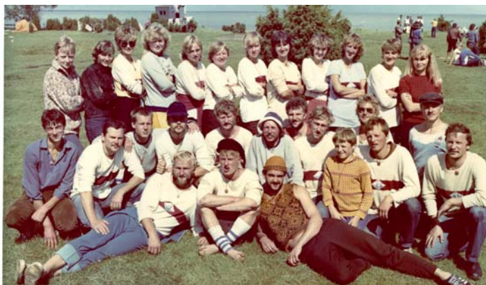
Viimane aasta Muhus – 1984.

Teiseks ühendas Muhu endas selle, mida tegelikult kõik rühmad tahtsid – et oleks hea teenistus ja pull suvi.